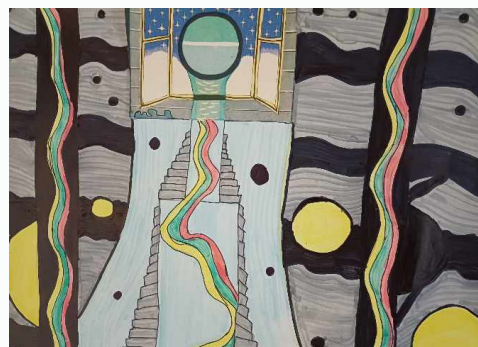
IVONA BANEVIČIŪTĖ 10KL.

Atsakymai: Horizontaliai: 1. Rimutė 3. Austėja 5. Kabinetas 7. Sesutė 8. Krepšini 10. Choras 11. Sigitos 12. Inovatyvi 13. Valgykla 14. Ukvedys Vertikaliai: 2. Uniformos 4. Uchmonas 6. Antanas 9. Septyniolika 15. Boso